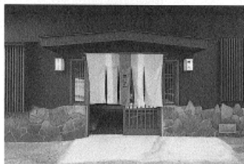
古民家風の入り口