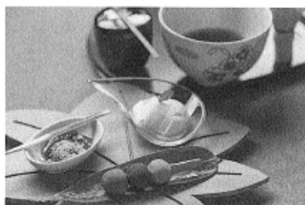
ウエルカムスイーツ