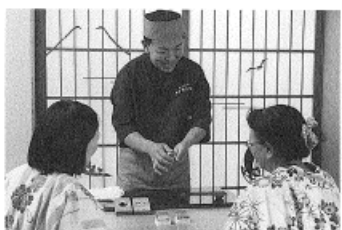
和菓子の練り切り体験